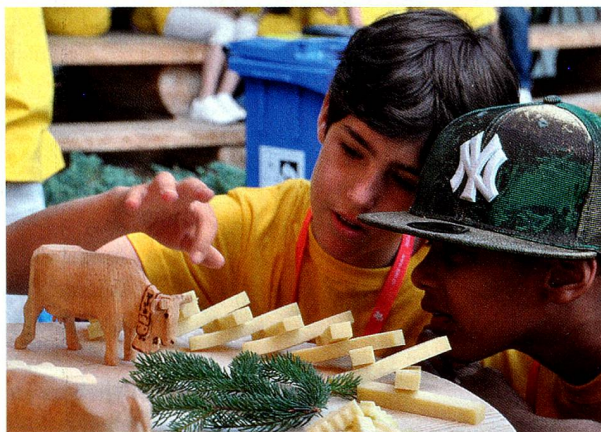
Fröhliches Treiben während eines früheren Sommerlagers der Stiftung für junge Auslandschweizer

Möglichkeit, den Lagerbeitrag zu reduzieren. Das Antragsformular kann zusammen mit der Anmeldung angefordert werden.