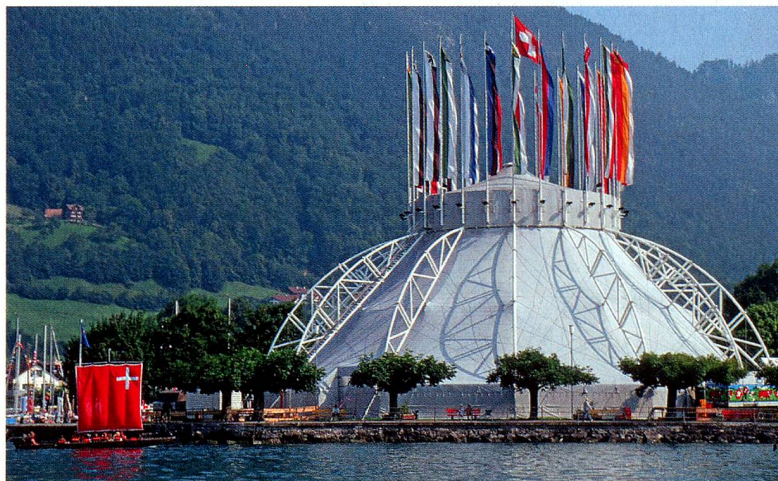
Der Auslandschweizerplatz im Jahr 1991 mit dem Botta-Zelt, das zur Feier von 700 Jahre Eidgenossenschaft aufgestellt wurde

Die Frist für das Einreichen von Ideen ist der 31. März 2012. Die prämierten Ideen werden im Juli/August in Brunnen und anlässlich des Auslandschweizer-Kongresses in Lausanne im August 2012 der Öffentlichkeit gezeigt.