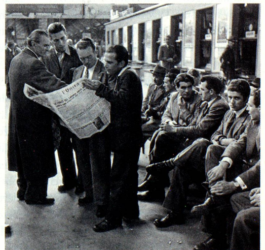
Italienische Gastarbeiter am Bahnhof in Zürich, um 1950