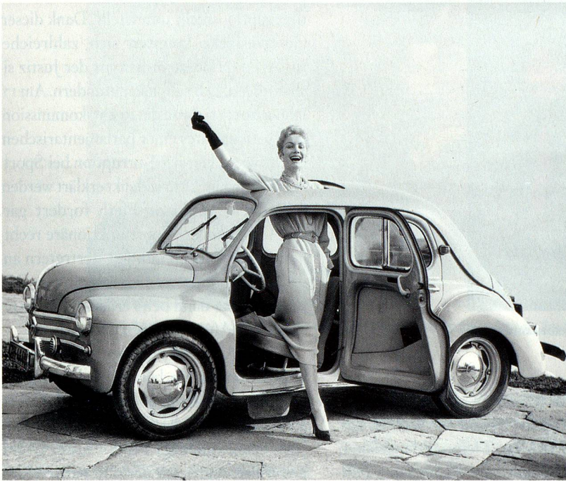
Bilder im Uhrzeigersinn: Renault-Heck-4CV, Werbung um 1964

«Schöner leben, mehr haben», Limmat Verlag, Zürich; Herausgeber Thomas Buomberger und Peter Pfunder; 267 Seiten; ISBN: 978-3-85791-649-6; Preis: ca. CHF 48.–