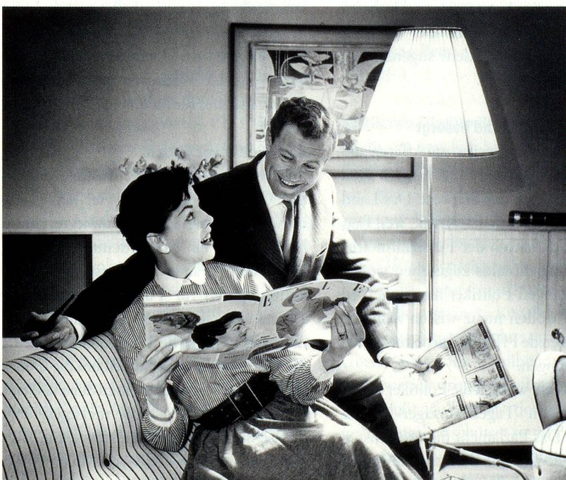
Fröhliches Musterehepaar um 1958, Bild von Max Roth (ohne Titel)