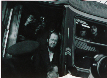
Ankunft von Nobelpreisträger Alexander Soltschenizyn in Zürich am 15.2.1974. Soltschenizyn war von der russischen Regierung wegen seines Buchs «Archipel Gulag» ausgebürgert worden. Zwei Jahre nach seiner Ankunft in der Schweiz übersiedelte er in die USA