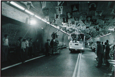
Eröffnung des Gotthard-Strassentunnels am 5.9.1980