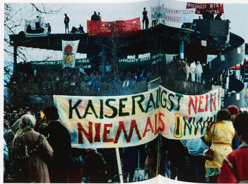
Kundgebung von Gegnern des geplanten Kernkraftwerks in Kaiseraugst im Jahr 1985