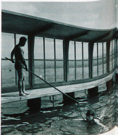
Schwimmunterricht für Schulklassen im Seebad Wollishofen in Zürich im Jahr 1943

In den 1960er-Jahren hatten Fotografien, die es in eines der zahlreichen illustrierten Magazine schafften, einen langen Weg hinter sich: Zwischen dem Knipsen einer Kamera und dem Moment des Betrachtens der Bilder im Salon oder am Küchentisch vergingen mindestens ein paar Stunden, normalerweise waren es eher Tage oder Wochen. Besonders die Arbeit des Fotografen war zeitraubend. Nachdem er von einem Ereignis zurückgekehrt war, verbrachte er zunächst für ein paar Stunden in der Dunkelkammer, entwickelte seine Filme, traf eine erste Auswahl und vergrösserte die besten Negative. Die Abzüge gelangten an die Bildagenturen oder die Redaktionen, wo die Auswahl weiter reduziert werden musste, bevor die Bilder in die Magazineseiten eingepasst wurden, in den Druck gelangten und schliesslich an Kioske und Haushalte im ganzen Land verteilt wurden.