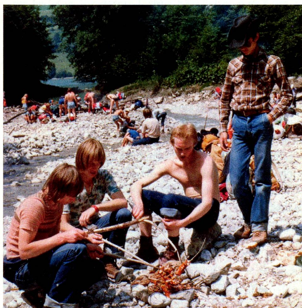
Fotos aus dem Lager 1978. Erkennen Sie sich auf einem der Fotos? Melden Sie sich doch bei uns! sjas@aso.ch