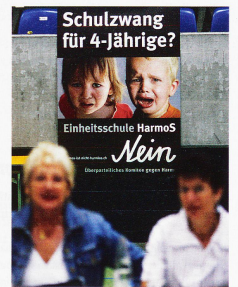
Plakat der SVP gegen Schuleintritt mit vier Jahren

Die SVP Kampagne wurde zum Präzedenzfall. Nun versuchen alle grossen Par-