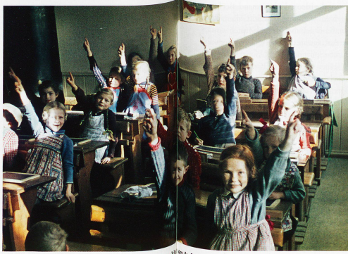
Die Schule in den Vierzigerjahren: Die Lehrer hatten einen hohen Anspruch, die Schüler waren diszipliniert und folgsam

HarmoS – Kürzel für «Harmonisierung der obligatorischen Schule» – ist eine interkantonale Vereinbarung, welche die wichtigen Eckpunkte der Schweizer Volksschule festlegt. Die Bevölkerung selbst wollte mit 26 verschie-