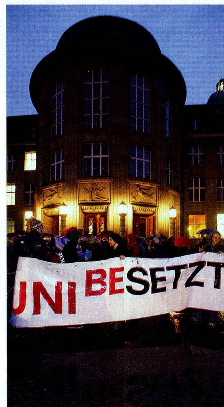
Studentenproteste in Zürich

Gräben und Fronten bildeten sich auch zwischen den verschiedenen Schulstufen: Die oberen klagten, die Schüler würden in den unteren Stufen schlecht vorbereitet. Die Initialzündung für den Disput gab die angesehene ETH in Zürich, als sie 2009 ein Ranking der Deutschschweizer Gymnasien veröffentlichte. Sie wertete die Prüfungsergebnisse der Erstsemestrigen aus und klassierte die Herkunftsgymnasien nach deren Leistung. Trotz der Entrüstung in der pädagogischen Welt haben Universitäten und Hochschulen begonnen, Druck bei der Grundausbildung zu machen. Mit Erfolg. Die neue Losung heisst «Effizienz» und Schluss mit sympathischen, künstlerischen