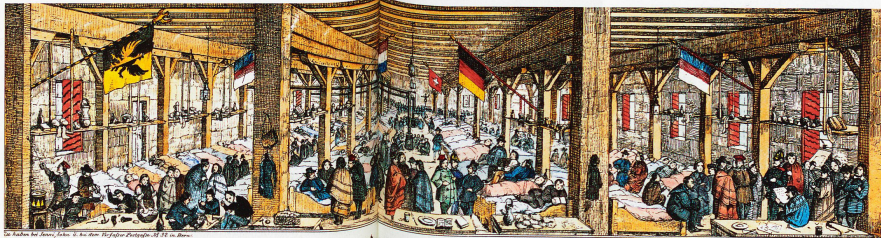
Großer Flüchtlingssaal im Kornhaus in Bern, Januar 1850. Salon des réfugiés

«Schweizer Geschichte im Bild» Verlag hier+jetzt Basel; 292 Seiten, 425 Abbildungen; ISBN 978-3-03919-244-1; CHF 78.–, EUR 60.–; www.hierundjetzt.ch