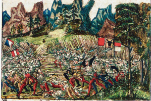
Die Schlacht am Morgarten (1315) war die erste Schlacht der Eidgenossen gegen die Habsburger. Darstellung aus der Bildchronik des Christoph Silbereysen von 1576