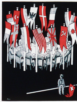
«Die isolierte Schweiz», eine Karikatur im «Nebelspalter» vom Oktober 1945