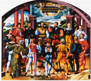
Der Bundesschwur von 13 eidgenössischen Ständesvertreter mit Niklaus von der Flüe vorne links. Das Bild von Humbert Mareschet aus dem Jahr 1586 hängt im Rathaus in Bern