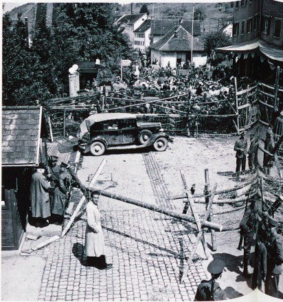
Flüchtlinge am Grenzzaun von St. Margrethen bei St. Gallen im Mai 1945