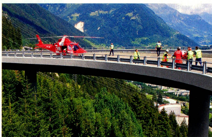
Einsatz bei Verkehrsunfällen: Oft wird die Rega von der Polizei gerufen

zer Medien machten publik, dass die Rega ihre Ambulanzjets auch für Auftragsflüge ohne Schweizer Beteiligung einsetzt, und dabei ab und zu ausländische Soldaten aus Kriegsgebieten in ihre Heimat transportiert. Die Rega fliegt in der Tat im Auftrag internationaler Versicherungen solche Einsätze, wenn diese medizinisch notwendig sind. Für sie gebe es nur Patienten, ob mit oder ohne Uniform, heisst es bei der Rega. Sie betont auch, dass in diesen Fällen den Auftraggebern die vollen Kosten, inklusive Unterhalts- und Amortisationskosten der Flugzeuge, verrechnet werden. Gönnergelder würden nie für Auftragsflüge verwendet. Die Stiftungsaufsicht gab der Rega recht und entlastete sie vom Vorwurf des «Missbrauchs des Schweizer