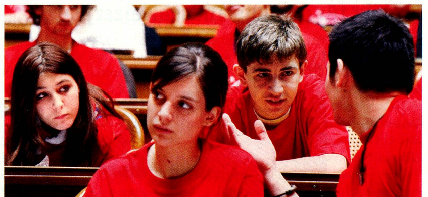
Jugendliche im Nationalratssaal in Bern während der Jugendsession