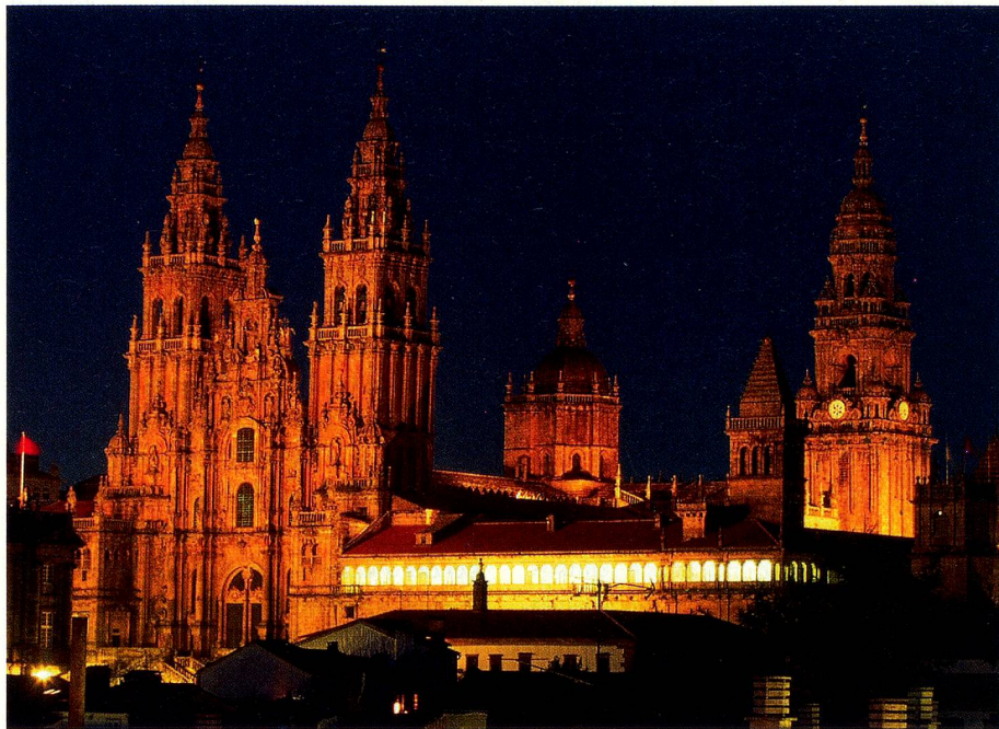
Die Kathedrale von Santiago de Compostela