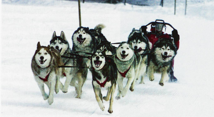
Ein Gespann in vollem Einsatz beim Schlittenhunderennen in Kandersteg