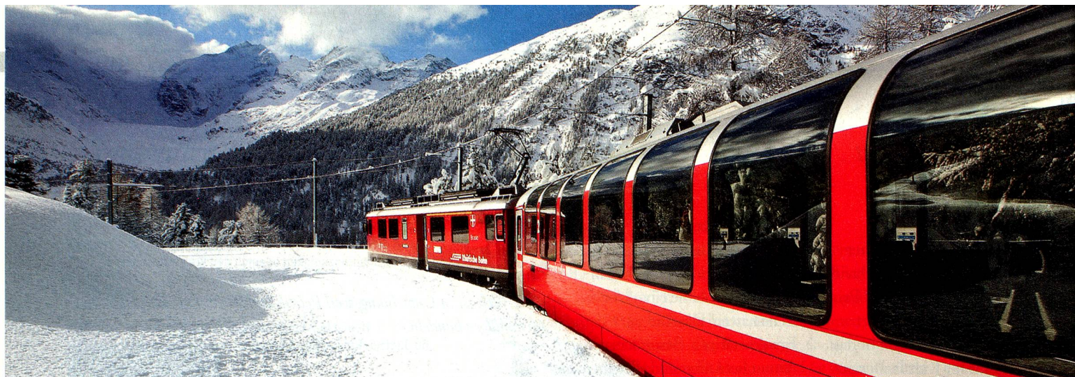
Bernina Express am Lago Bianco, Graubünden