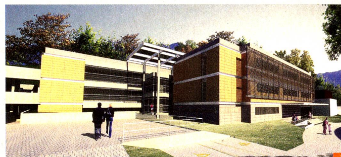
Novo prédio da ESB-RJ

A SIS - Swiss International School, esta construindo uma nova Escola, que abrigará, a partir do ano letivo de 2014, as turmas da Educação Infantil e os primeiros três anos do Ensino Fundamental I da Escola Suíço-Brasileira Rio de Janeiro.