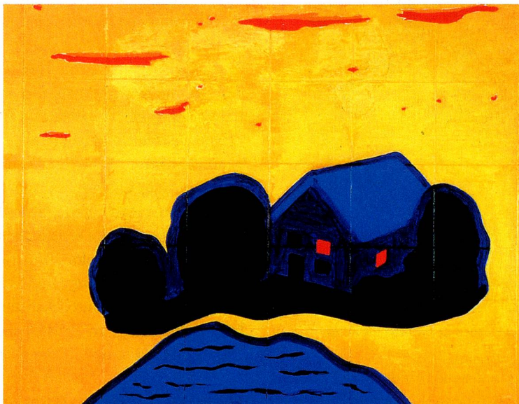
«Ein Abend im Jahr 1910» aus dem Jahr 1972

ein Bierglas mit buschigem Pelzschwanz, persifliert die berühmte Pelztasse. Im «Portrait mit Tätowierung» (1980) besprays sie ihr Konterfei mit einem Schablonenmuster und beansprucht so deutlich die Hoheit über ihr eigenes Bild. Wiederholt nimmt sie sich der Wolken an, dieser duftig-ephemeren Himmelsphänomene, in denen die menschliche Phantasie seit Jahrhunderten schon Luftschlösser erbaut. Meret Oppenheim gestaltet scharf umrissene Wolken in Öl auf Leinwand, als Federzeichnung oder in der zeitlos schönen Bronze «Sechs Wolken auf einer Brücke» (1975). Das Thema Weiblichkeit führt sie in Objekten wie den mit Adern bestickten «Handschuhen» (1985) fort.