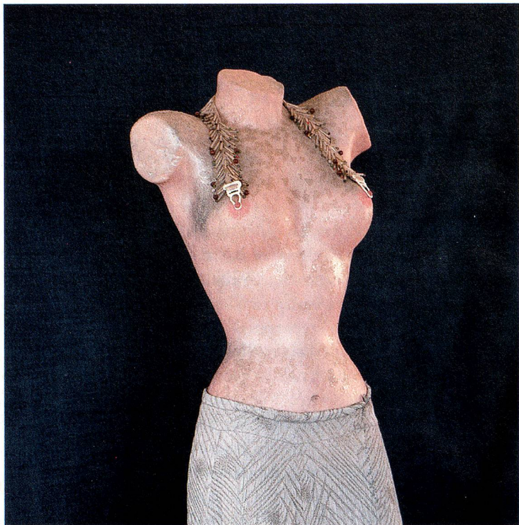
«Abendkleid mit Büstenhalter-Collier» aus dem Jahr 1968