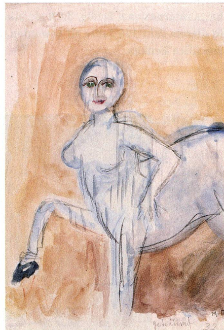
«Kentaurin auf dem Meeresgrund» aus dem Jahr 1932

Jahr vom Museum of Modern Art in New York angekauft wird.