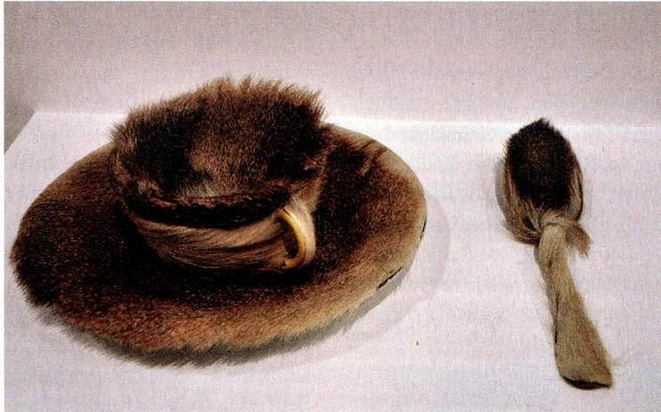
«Pelztasse» aus dem Jahr 1923