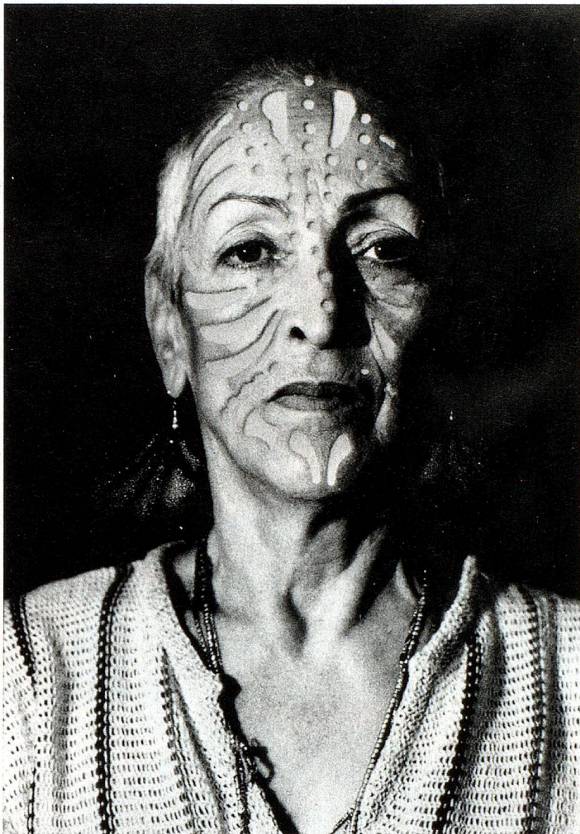
Oppenheims berühmtes «Porträt mit Tätowierung» aus dem Jahr 1980