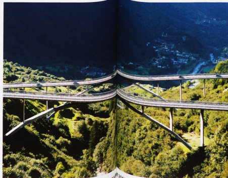
Ponte Nanin und Ponte Castella in Mesocco, fotografierter Anfang des 20. Jahrhunderts