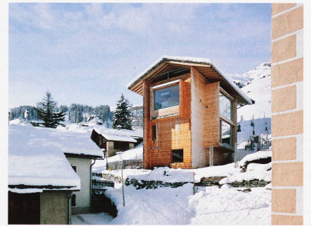
Vom Architekten Peter Zumthor erbautes Haus in Leis, fotografiert 2012 von Ralph Feiner