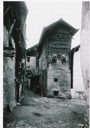
Wohnhaus in Zuoz, fotografiert von Rudolf Zinggeler