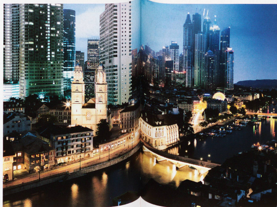
Ein Szenario der Zuwanderungskritiker für die Stadt Zürich

Damit können die erwähnten Probleme jedoch nicht vom Tisch gewischt werden. Mittlerweile ist die SVP längst nicht mehr die einzige Partei, bei der die Einwanderung auf der Traktandenliste steht. Auch die Sozialdemokraten nehmen die Ängste der Bevölkerung zu Kenntnis. Sie haben deshalb 2012 ein Migrationspapier präsentiert. Sie wollen aber nicht gleich die Personenfreizügigkeit aufkündigen wie die SVP. Ihr Rezept