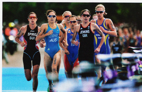
Triathleten in Aktion: schwimmen, Rad fahren, laufen