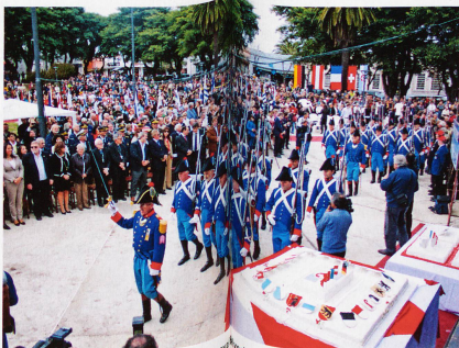
2012 wurde mit Militärparaden 150 Jahre Unabhängigkeit in Uruguay gefeiert. Etwa 1000 Auslandschweizer leben derzeit in dem südamerikanischen Land