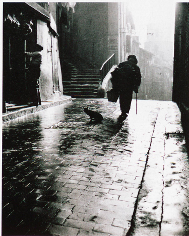
Gasse in Marseille am frühen Morgen

zeigt anhand von Einzelschicksalen und Biografien in zwei Museen, was Auswanderung bedeutet und wie die Ausgewanderten in aller Welt ein Stück alte Heimat in eine neue Heimat zu integrieren versuchen. Ausstellung: «Appenzeller Auswanderung – Von Not und Freiheit» im Volkskunde-Museum in Stein und im Brauchtummuseum in Urnäsch. Dauer: bis 27. Oktober in Stein, bis 13. Januar 2014 in Urnäsch. www.appenzeller-museum-stein.ch , www.museum-urnaes.ch .