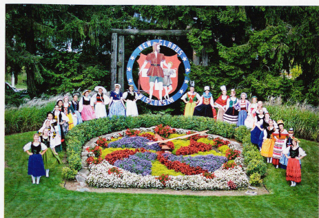
In New Glarus, gegründet 1845, werden viele Traditionen seit Generationen weitergeführt