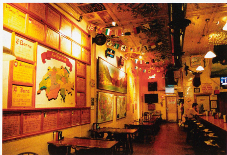
«The Original Baumgartner», die Schweizer Taverne mit Käseladen in Wisconsin existiert seit 1931