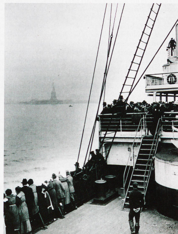
Auswanderer auf einem Schiff vor New York, aufgenommen 1915 von Edwin Levick