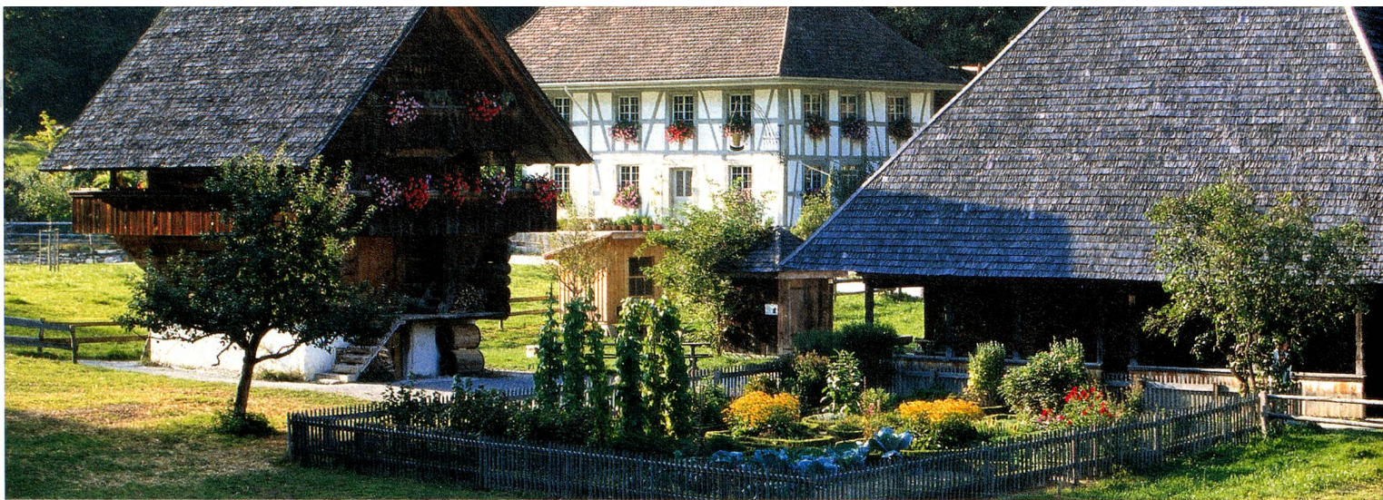
Ballenberg, das Freilichtmuseum für ländliche Kultur, Berner Oberland