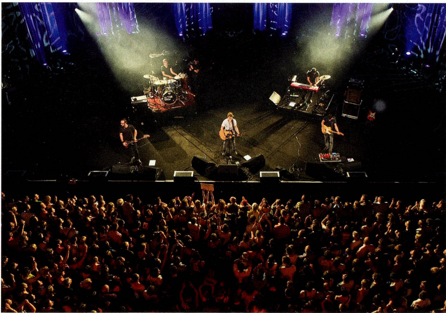
Beim grossen Auftritt im Auditorium Stravinski in Montreux

Konzert nach dem anderen. Er tritt in Deutschland, Moskau, New York und Los Angeles auf, es ist klar, wo seine Ambitionen liegen. «Ich würde gern den Durchbruch in Russland schaffen, in einem Markt, der in der Schweiz allen egal ist. Russland interessiert kaum jemanden. Das reizt mich.»