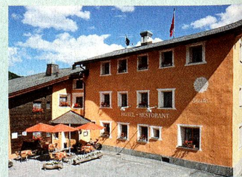
MySwitzerland.com Webcode: A54633

Melden Sie sich bis zum 30. September 2013 auf www.MySwitzerland.com/aso an und gewinnen Sie 2 Nächte für 2 Personen im Typischen Schweizer Hotel Landgasthof Staila*** in Fuldera für einen atemberaubenden Aufenthalt im Val Müstair.