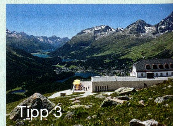
MySwitzerland.com Webcode: C58592

Hoch über einer der schönsten Landschaften des Engadins, St. Moritz, liegt das Hotel Muotatas Muragl auf 2456 Metern ü. M. Mit seinem modernen alpinen Design, einem breiten gastronomischen Angebot und fantastischen Ausflugsmöglichkeiten ist es einzigartig.