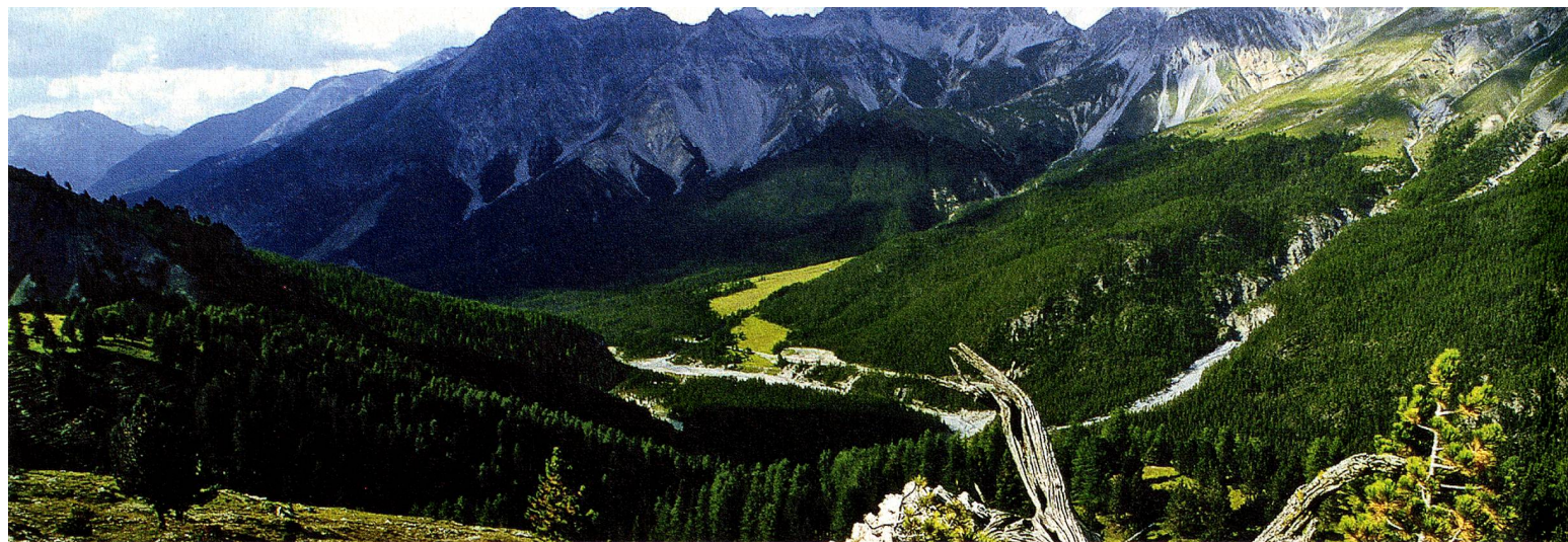
Schweizerischer Nationalpark, Graubünden