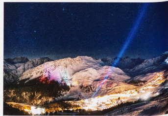
Silvesternacht in Arosa, aufgenommen von Tschuggen, 1. Januar 2012

Buch: «Helvetia by night» Verlag NZZ Libro, Zürich, 2013; 192 Seiten, 100 Abbildungen mit fototechnischen Erklärungen im Anhang, CHF 84.– Mehr unter: helvetiabynight.com/