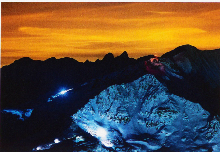
Pistenfahrzeuge und Schneekanonen am Corvatsch, aufgenommen vom Piz Nair, 12. Dezember 2012