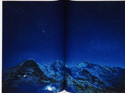
Sternbild Orion über Eiger, Mönch und Jungfrau, aufgenommen vom Männlichen, 31. Januar 2011