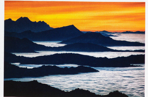
Nebelmeer über den Voralpen, mit Pilatus und Rigi, aufgenommen vom Säntis, 24. November 2011