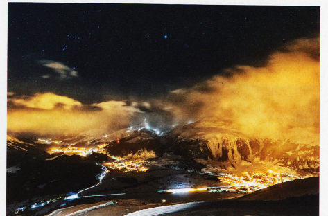
St. Moritz, Celerina und Samedan, aufgenommen von Muottas Muragl, 9. Februar 2013