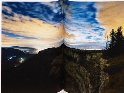
Creux du Van, aufgenommen am 20. November 2011