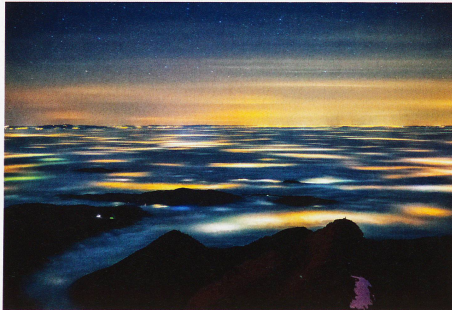
Nebelmeer über dem Mittelland, aufgenommen vom Säntis, 24. November 2011