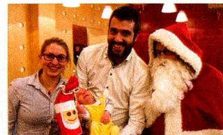
Welch eine Freude – der Samichlaus und unser jüngstes Mitglied