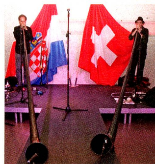
Musikalische Unterhaltung Duo „Windbone“