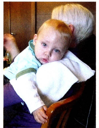
Unser jüngster Teilnehmer

immer wieder. Den einen plagt das Heimweh, den anderen seine Alltagsorgen. Doch hier fühlen wir uns geborgen wie in einer Familie und geniessen die nette Gemeinschaft. Ich möchte auf diesem Wege im Namen unseres Präsidenten wieder einmal alle Schweizer in Kärnten, aber selbstverständlich auch deren Angehörige, einladen, ein Tref-