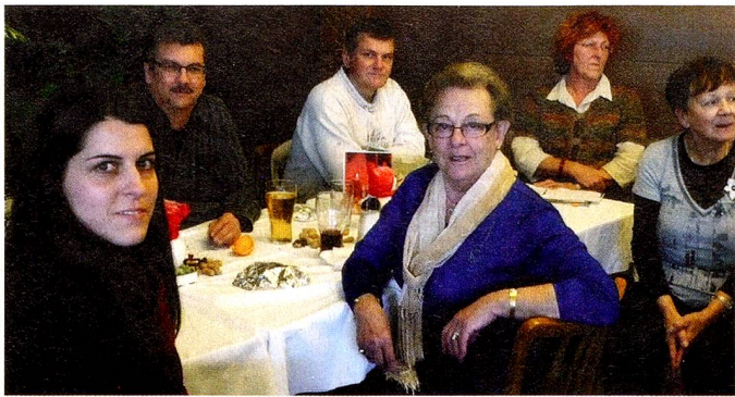
Wir lauschen den Worten unseres Präsidenten