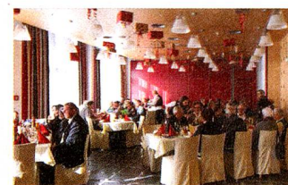
Ausgesprochen viele Mitglieder besuchten unsere diesjährige Weihnachtsfeier im Hotel Bokan