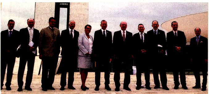
Delegação em Brasília