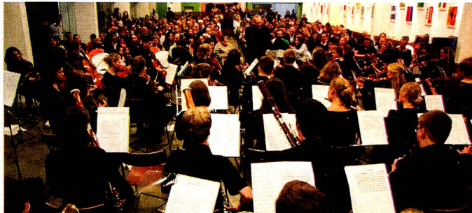
Orquestra Sinfônica Jovem da Basileia. www.esbsp.com.br