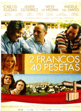
Affiche du nouveau film. Plakat des neuen Films.

Son thème est l'émigration: le comédien et metteur en scène espagnol Carlos Iglesias, 59 ans, a déjà remporté un grand succès avec «1 Franco, 14 Pesetas». Fin mars, les cinémas espagnols ont présenté, en Première, la suite de son film intitulé «2 Francos, 40 Pesetas».