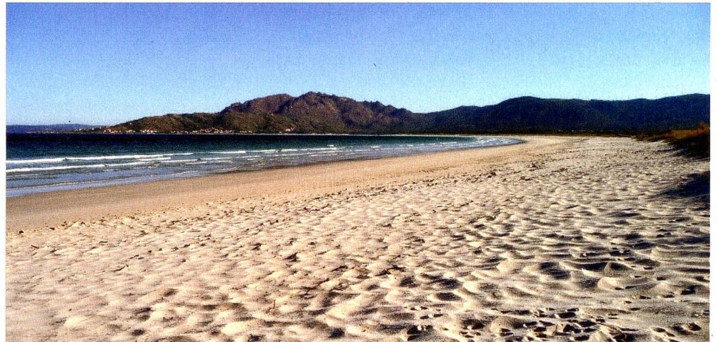
Près d'Ebbe, quelques endroits de plus de 500 m de large : avec le Monte Pindo sur le côté nord du golfe, la plage de Carnota est une grande réserve naturelle.

patrie. Certains avec des cadeaux et des histoires du «paradis», d'autres au volant de voitures rutilantes. La réussite matérielle se manifestait ainsi: on voulait montrer à ceux qui étaient restés ce qu'on avait acquis, au moins pendant quelques semaines dans l'année. ANTONIA KUHN Traduction: Béatrice Peissard