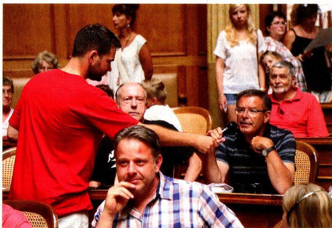
Am Tag der offenen Tür erhält ein Besucher das Mikrofon