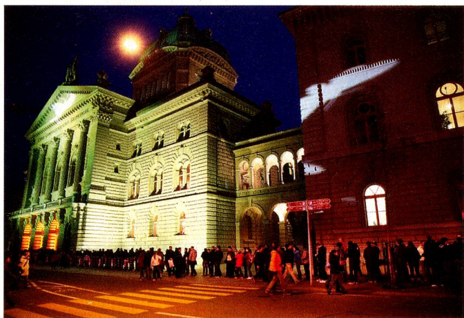
Rund 4000 Besucherinnen und Besucher in der Museumsnacht

Virtueller Rundgang: www.parlamentsgebaeude-tour.ch