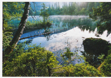
Crestasee bei Flims im Kanton Graubünden