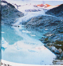
Der Fluss zum Mörjensee am Rand des Grossen Aletschgletschers im Kanton Wallis