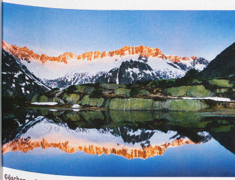
Göscheneralp im Kanton Uri mit den Gipfeln der Dammakette im Hintergrund