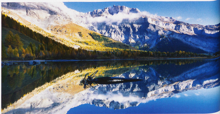
Lac de Derborence im Kanton Wallis mit der Felsspitze Tour Saint-Martin, auch Quille du Diable (Teufelskegel) genannt