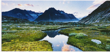
Der Fluss zum Mörjensee am Rand des Grossen Aletschgletschers im Kanton Wallis