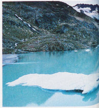
Gaulegletscher im Kanton Bern und der See im Vordergrund