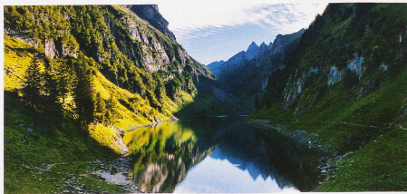
Fählensee im Kanton Appenzell Innerrhoden mit der Spitze des Altmann im Hintergrund