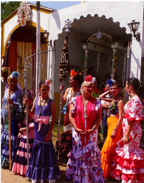
Prière et danse: à l'occasion de la Romería, les dames ont sorti leurs plus beaux costumes de Flamenco de leur armoire.