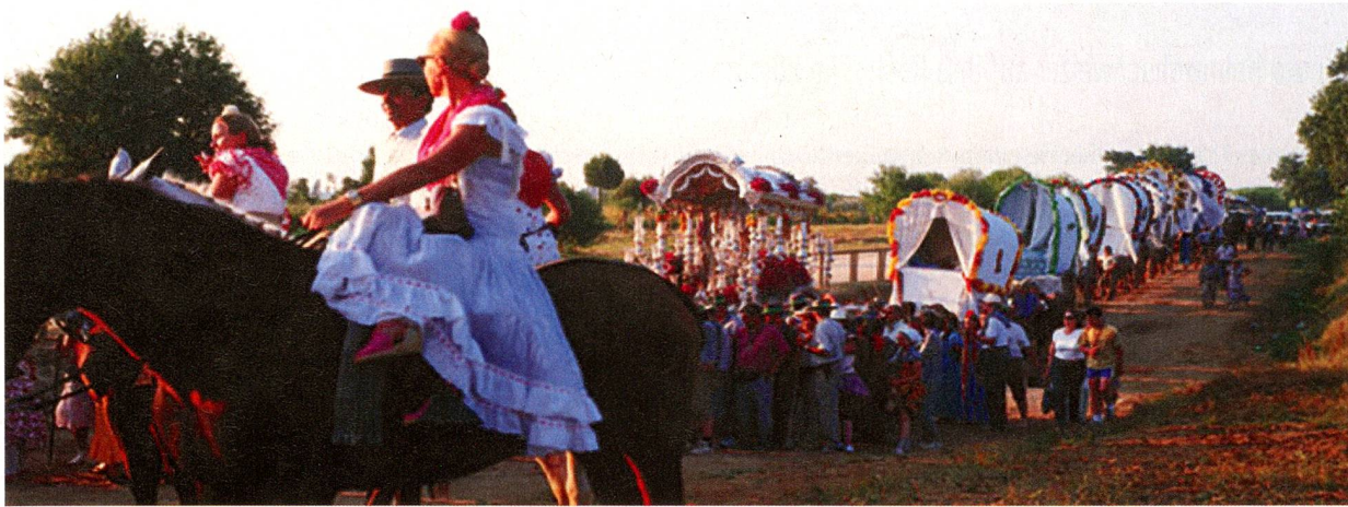
Auf dem Weg zur Romería del Rocío: Die Wallfahrer sind hoch zu Ross, zu Fuss und mit Pferdekarren unterwegs.