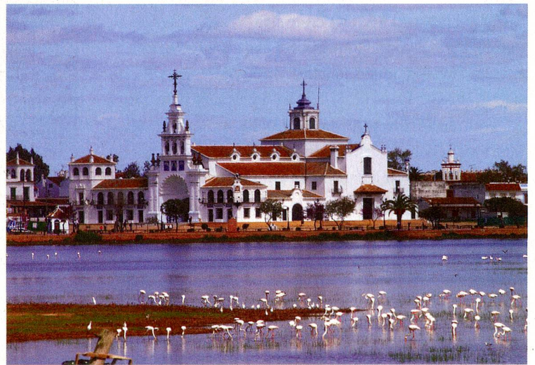
Malerisch: Die Ermita von Rocío liegt am Ufer des Guadalquivir.