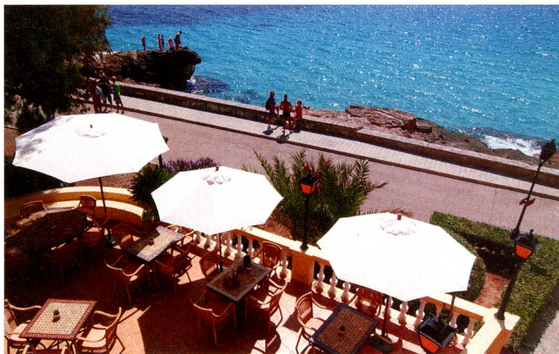
Nicht nur bei Schweizern beliebt: Die Terrasse des Restaurants "Del Mar" in erster Meereslinie.

Il n'y a pas que les Suisses qui apprécient la terrasse du restaurant "Del Mar" en bord de mer.