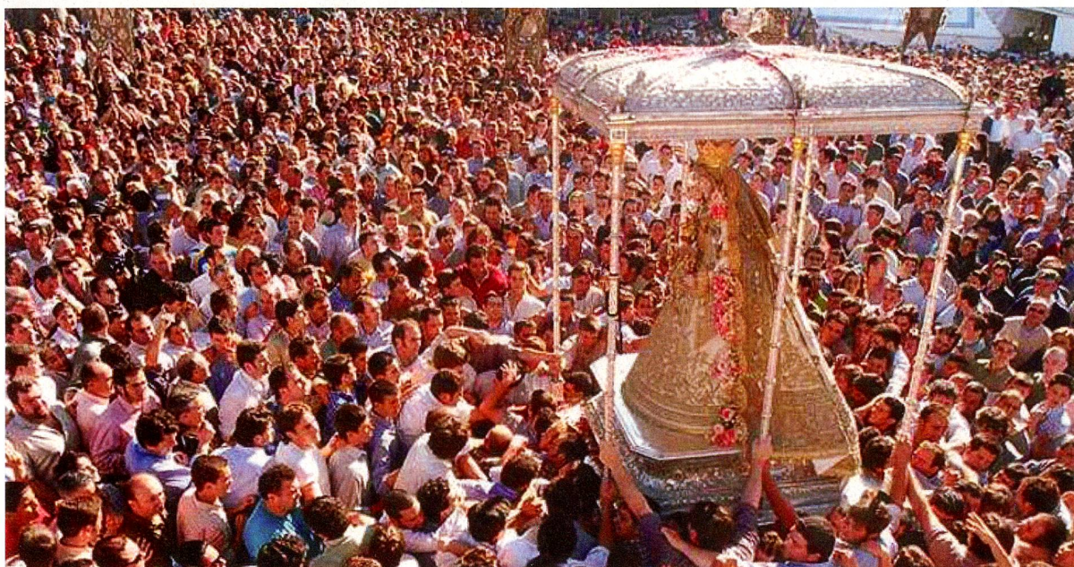
Der Höhepunkt: Die Virgen del Rocío, genannt "La Paloma Blanca", wird durch die jubelnde Menge zu den Bruderschaften getragen.