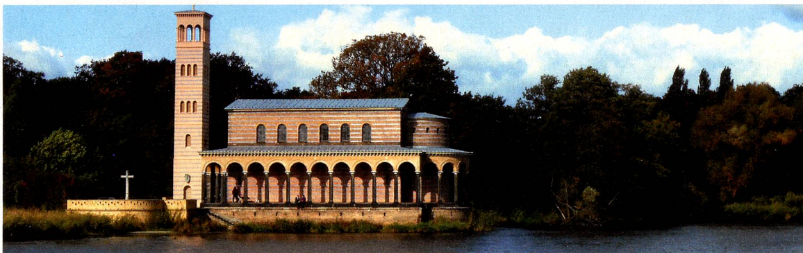
Die Sacrower Heilandskirche entstand 1844 nach Zeichnungen von Friedrich Wilhelm IV. im italienischen Stil mit freistehendem Campanile.