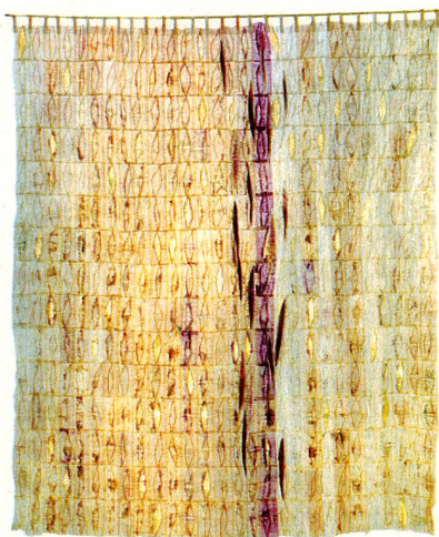
Judith Mundwiler: Seelenwanderung

Das Textil- und Industriemuseum zeigt in seiner Sonderausstellung «Quilt – 22 textile Positionen» bis 28. Juni Werke von 22 deutschen und Schweizer Textilkünstlerinnen.