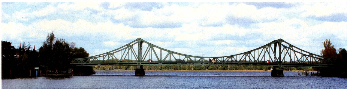
Die Glienicker Brücke verbindet heute wieder Berlin mit Potsdam