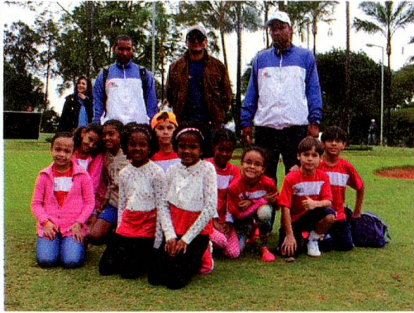
Crianças que participaram da Copa Suíça

O evento, tanto para os participantes adultos como para as crianças, foi um grande sucesso, e a Embaixada da Suíça espera poder voltar em breve com uma nova edição.