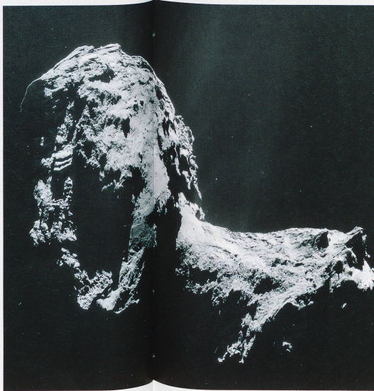
Der Komet Tschury – sein offizieller Name Tschurjumow-Gerassimenko