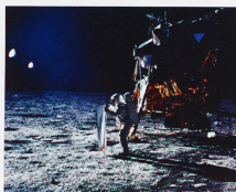
Sonnensegel der Apollo 11: eines der Experimente des Berner Professors Johannes Geiss

Schweizer Revue / Februar 2015 / Nr. 1