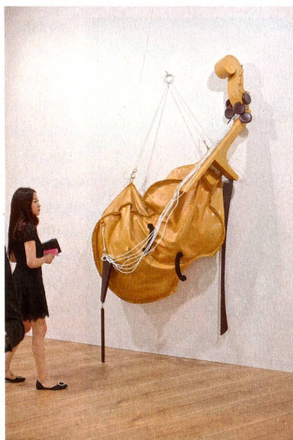
Kunst und Besucher der Art Basel

GERHARD MACK IST KULTURREDAKTOR BEI DER «NZZ AM SONNTAG»