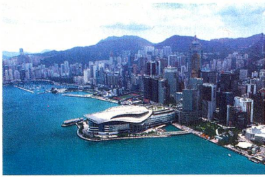
Der Kultur-Distrikt von West Kowloon in Hongkong

die neue Halle der Architekten Herzog & de Meuron ein äusseres Zeichen: die Art Basel im zeitgenössischen Kunstmarkt eine Art Ozeandampfer auf dem Meer der längst unübersichtlich gewordenen Zahl der Kunstmesse.