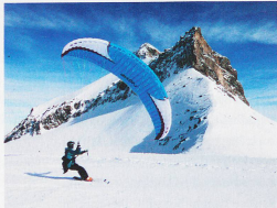
Speed Flying ist nur in wenigen Gebieten erlaubt