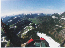
Gleitschirmflieger beim Alpstein

Wollen Sie in der Schweiz fliegen? Nichts einfacher als das, ist das Land doch gespickt mit Flugschulen, Flugvereinen und Berufspiloten. Dem SHV zufolge kostet ein Probestag mit einem Flug von 10 Metern 120 Franken. Für das Gleitschirmfliegen braucht man eine Fluglizenz (Brevet). Die Ausbildung dauert ein Jahr, damit der Pilot unter den unterschiedlichsten Witterungsbedingungen sicher fliegen kann, so der SHV. Die Ausbildung kostet ungefähr 1800 Franken und das komplette Material rund 5000 Franken. Gleitschirmfliegen ohne Brevet ist verboten. Und die Ausbildung in der Schweiz ist «hart», meint Christian Jähr.