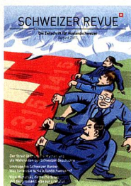
Titelbild: Illustration von Andrea Caprez über den Streit um die Schweizer Geschichte