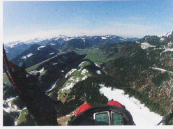
Gleitschirmflieger beim Alpstein

Wollen Sie in der Schweiz fliegen? Nichts einfacher als das, ist das Land doch gespickt mit Flugschulen, Flugvereinen und Berufspiloten. Dem SHV zufolge kostet ein Probestag mit einem Flug von 10 Metern 120 Franken. Für das Gleitschirmfliegen braucht man eine Fluglizenz (Brevet). Die Ausbildung dauert ein Jahr, damit der Pilot unter den unterschiedlichsten Witterungsbedingungen sicher fliegen kann, so der SHV. Die Ausbildung kostet ungefähr 1800 Franken und das komplette Material rund 5000 Franken. Gleitschirmfliegen ohne Brevet ist verboten. Und die Ausbildung in der Schweiz ist «hart», meint Christian Jöhr.