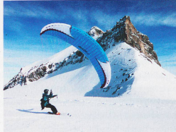
Speed Flying ist nur in wenigen Gebieten erlaubt