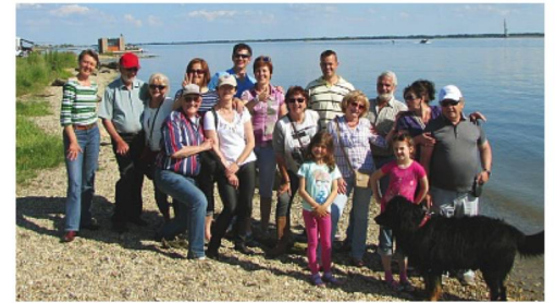
Ausflug in die Region der Beskyden in Ostmähren

Die sagenumwobene Region mit dem Berg «Tanečnica» und dem Denkmal des heidnischen