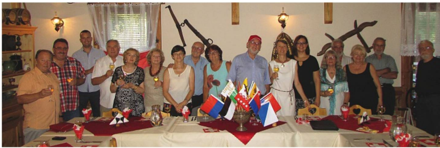
1. August-Feier in Podkylava/Region Myjava