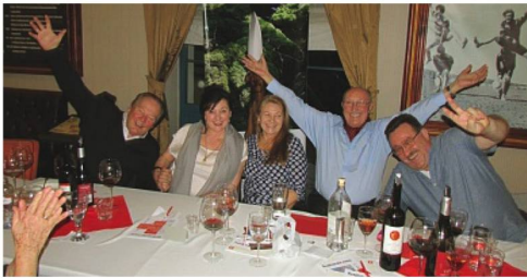
Schweizer kulinarischer Abend in Banská Štiavnica

Dieses Wochenende verbrachten 15 Mitglieder des Schweizerklubs zusammen mit dem Botschafter, Herrn Alexander Wittwer, in der historischen Stadt Banská Štiavnica in der Mittelslowakei. Die geladenen Gäste wurden im Hotel «Cosmopolitan» mit Spezialitäten aus verschiedenen Regionen der Schweiz verwöhnt. Eine slowakische Folkloregruppe in schönen Trachten bereicherte den Abend, anschliessend spielte eine Musikband zum Tanz auf. Erst spät am Abend (für einige Nachtschwärmer am frühen Morgen) ging dieser Anlass zu Ende.