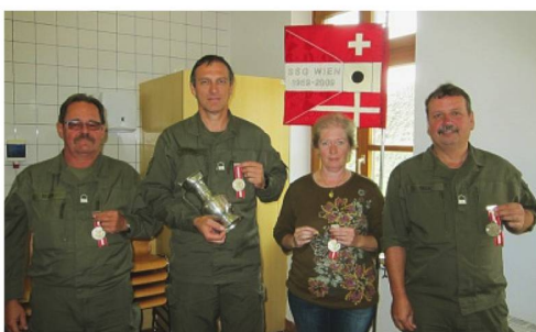
Siegerbild der Mannschaft des österreichischen Bundesheers