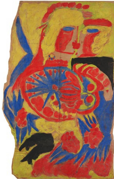
Aloïse Corbaz, Scène de baiser fleurie à la gouache, 1947, Bleistift und Gouache auf Papier, 120 x 75 cm.