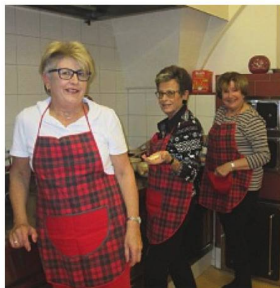
Unsere Wichtel bei der Arbeit

Eine besondere Freude war es, unter unseren Gästen Guardian und