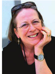
MONIKA UWER-ZÜRCHER REDAKTION DEUTSCHLAND

Elegante Fassaden, grosse, repräsentative Wohnungen, Vorgärten, grüne Plätze und ein eigener U-Bahnhof machten das Viertel aus. Zahlreiche Strassen erhielten die Namen bayrischer Städte. Die Gebäude bekamen verzierte Türmchen, gestufte Giebel und repräsentative Eingänge.