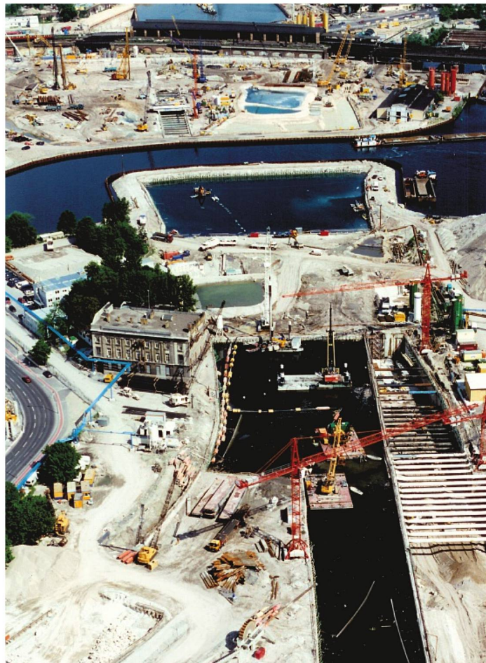
1997: Der Spreebogen während des Baus des neuen Regierungsviertels und des Bahntunnels zum Lehrter Bahnhof. In der linken Bildhälfte ist das Gebäude der Botschaft zu sehen.

Die diplomatische Vertretung der BRD wurde 1949 in Bonn eingerichtet und war von 1957–1977