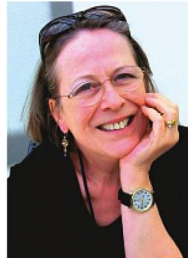
MONIKA UWER-ZÜRCHER REDAKTION DEUTSCHLAND

Zum einen wird vor den Bundestagswahlen im September nichts passieren, weil die Bundeskanzlerin ihre Partei ausbremst. Zum anderen braucht die Union auch nach den