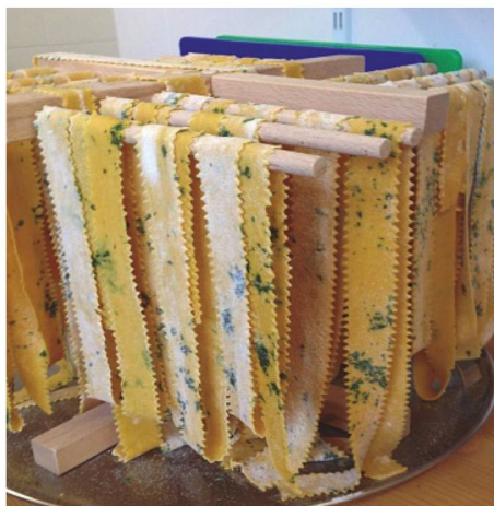
Der Phantasie sind keine Grenzen gesetzt - Teigwaren gibt es in verschiedensten Formen und Farben.

L'imagination n'a pas de limite : on trouve des pâtes de toutes formes et toutes couleurs.