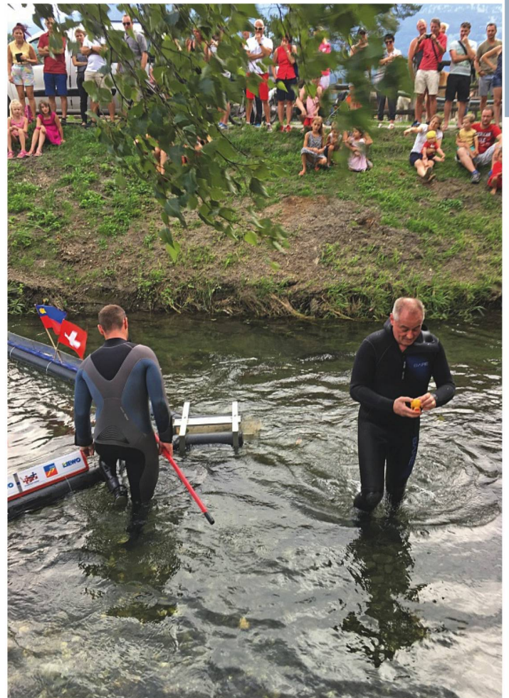
Wir freuen uns auf das nächste 1. August-Entenrennen anlässlich des Schweizer Nationalfeiertags!

Aufgrund der normalen Strömung waren die Rennenten dieses Jahr ganz ansehnlich schwimmend unterwegs. Die erste Ente erreichte nach 40 Minuten das Ziel bei Ridamm City. Nachdem die ersten Entchen (und natürlich auch die folgenden) herausgefischt wurden und alle Erinnerungsfotos geschossen wurden, begaben sich alle mitfiebernden Zuschauer zurück zu Ridamm City um dort den 1. August zu feiern. Es ging vorbei an den schönen Reitställen zurück zu Ridamm City, wo eine gemütliche Festwirtschaft, musikalische Unterhaltung warteten und um 22 Uhr das traditionelle Feuerwerk auf dem Programm standen.