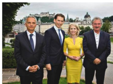
v.l.n.r.: Der Schweizer Bundesrat Didier Burkhalter, Österreichs Aussenminister Sebastian Kurz, Regierungsrätin Aurelia Frick und Luxemburgs Aussenminister Jean Asselborn am deutschsprachigen Aussenministertreffen in Salzburg

Nach dem Treffen im Sommer 2016 in Balzers fand die diesjährige Zusammenkunft der deutschsprachigen Staaten auf Einladung des österreichischen Aussenministers Sebastian Kurz am 27. Juli 2017 in Salzburg statt. Dieses war auch das letzte Treffen für Bundesrat Didier Burkhalter, der seinen Rücktritt für Ende Oktober angekündigt hatte. Er sprach in Salzburg mit dem Gastgeber Sebastian Kurz, der liechtensteinischen Aussenministerin Aurelia Frick und dem Luxemburger Aussenminister Jean Asselborn über aktuelle Entwicklungen in den einzelnen Ländern sowie über die Situation in Europa. Dieses Jahr nahm Deutschland nicht am jährlichen Treffen teil.