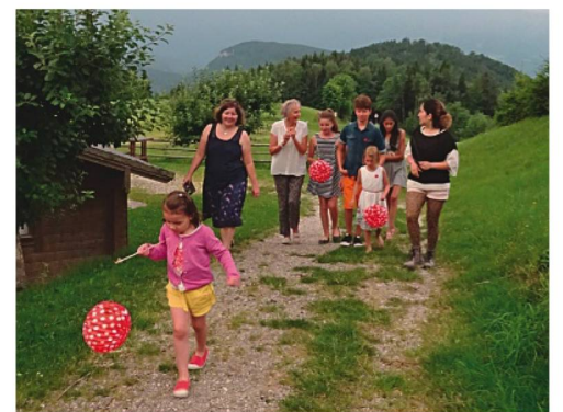
Lampionumzug auf der Zistelalm

In idyllischer hügeliger Landschaft bei schönem Wetter und traumhafter Aussicht konnte der Schweizer Verein Salzburg am Samstag, 5. August auf der Zistelalm die 1. August-Feier und die Generalversammlung abhalten. Der Ort war für die feierliche Umrahmung ideal: 35 Gäste und 12 Kinder fühlten sich rundherum wohl und waren in bester Feierlaune.