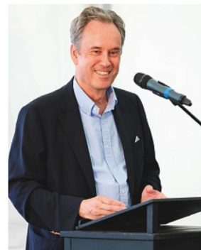
Botschafter Christoph Bubb eröffnet die Soirée Suisse 2017

Ein grosser Erfolg war das jährliche Netzwerk-Event «Soirée Suisse» am 28. Juni in der Residenz des Schweizer Botschafters. Über 200 Gäste aus