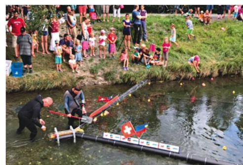
Zieleinlauf beim Entennen

Einer der Höhepunkte war das „Entennen“, bei dem die Mitglieder „Zertifikate“ kau-