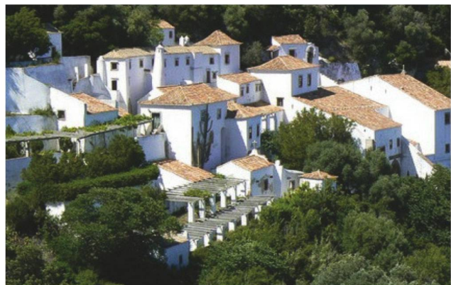
Malerische Ecken im Convento da Arrábida.

Dégustation de bière au petit village de pêcheurs de Sesimbra - la Arrábida Bee Company recueille de bonnes notes.