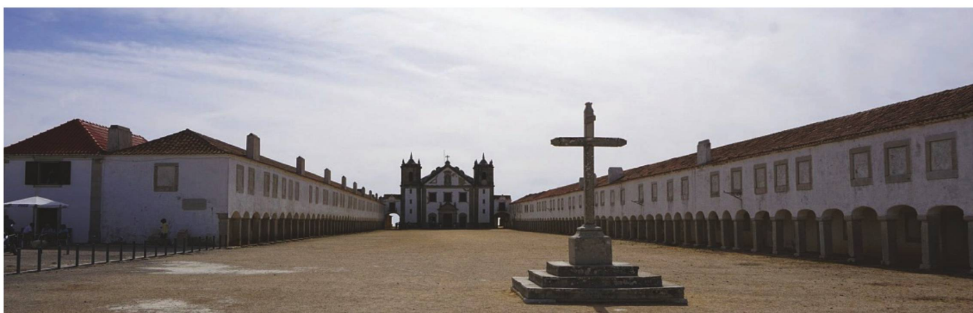
Imposantes Kloster: Das Convento Cabo Espichel.

À ne pas manquer: Ambiance relaxante de la plage à Sesimbra, un but d'excursion populaire, à une petite heure de Lisbonne..