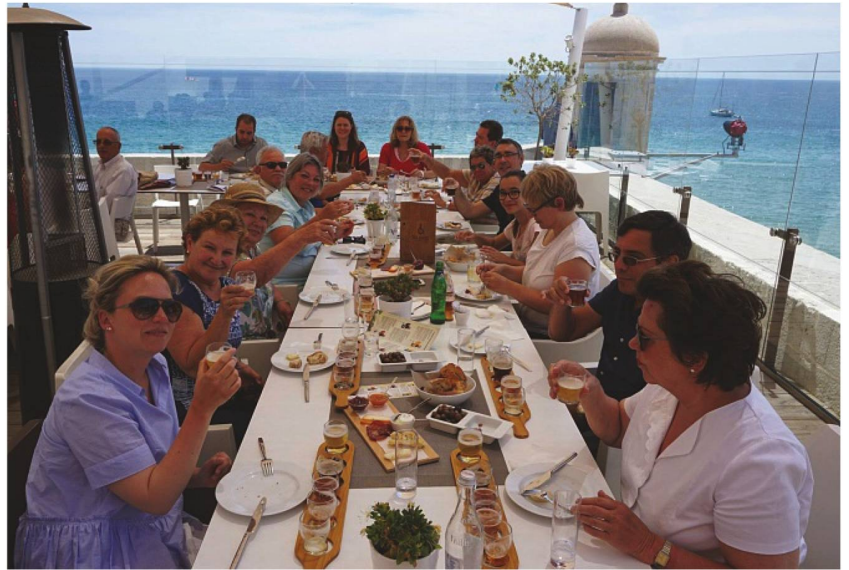
Bier-Degustation im Fischerdörfchen Sesimbra - die Arrábida Beer Company erhält gute Noten.

PATRICK EBERHARD/TRADUCTION: BÉATRICE PEISSARD