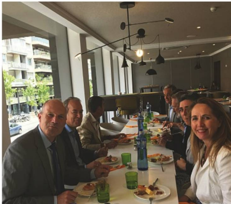
Pause de midi à l'hôtel de la Conférence: Tapas à la rescousse avant le vote des nouveaux membres du Conseil des Suisses de l'étranger.

Beindruckende Tour: Viele Teilnehmer der Präsidentenkonferenz liessen es sich nicht nehmen, Gaudis berühmte Sagrada Familia zu besuchen.