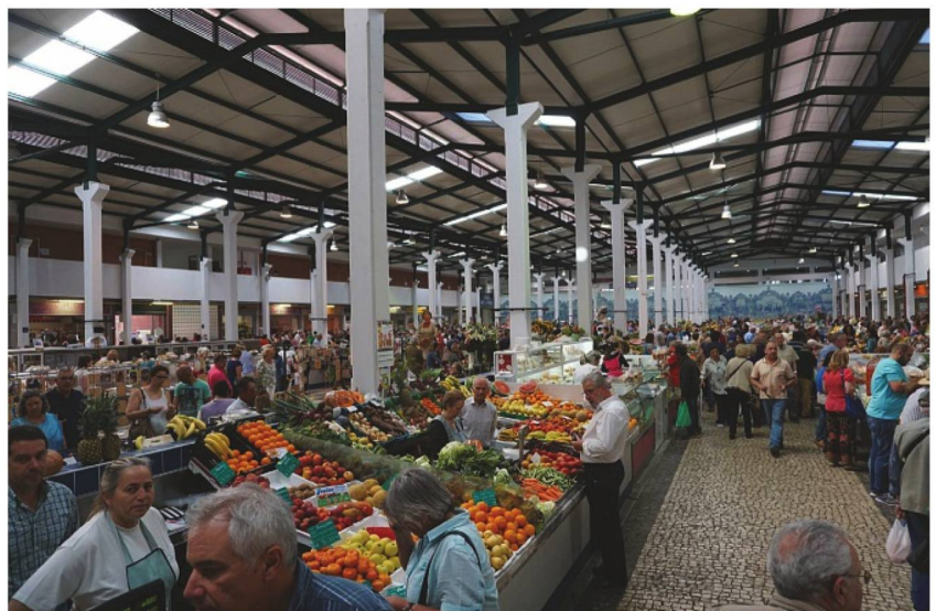
Beeindruckend: Die riesige Markthalle von Setúbal mit ihrem vielseitigen Angebot.

Coins pittoresques au Couvent de Arrábida.