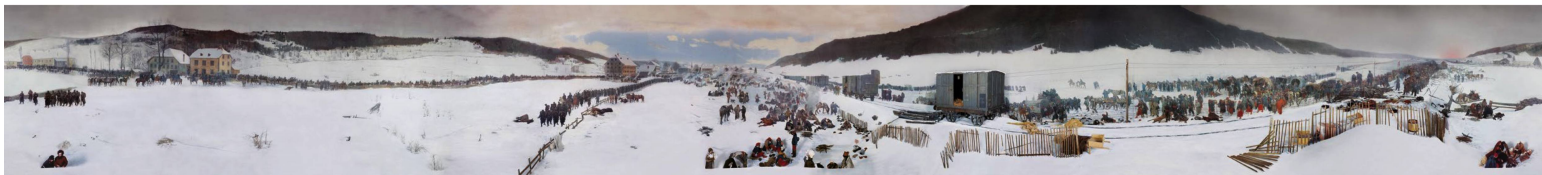
Das Luzerner Bourbaki-Panorama in seiner ganzen Pracht: Das Rundgemälde von Edouard Castres ist in natura 112 Meter lang.