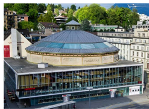
Das riesige Rundgemälde von Castres braucht ein entsprechend grosses Gebäude – umgeben ist es von der Luzerner Stadtbibliothek.

Während Jahrzehnten wurde das Bild in einer Rotunde in Basel gezeigt, dann aber Opfer eines wirtschaftli-