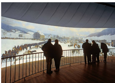
Schweizer Revue / Mai 2017 / Nr.3

Das Bourbaki-Panorama zeigt die französische Ostarmee bei einer denkwürdigen Flucht in die Schweiz während des Deutsch-Französischen Krieges 1871.