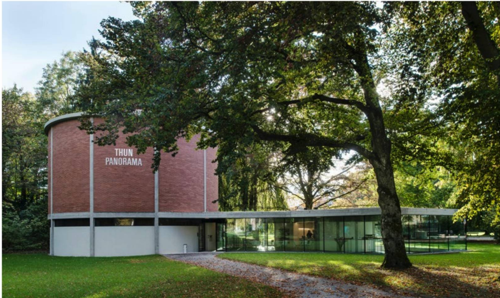
Das 7,5 Meter hohe und 38 Meter lange Panorama von Marquard Woher befindet sich in einem Park am Thunersee.