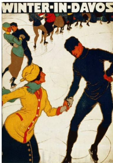
«Winter in Davos» (1914).

«Macht Ferien!» – Ausstellung bis 9. Juli 2017 im Museum für Gestaltung, Zürich. www.museum-gestaltung.ch