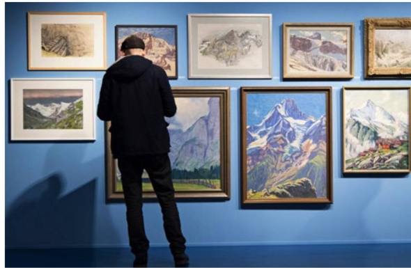
Aus der Ausstellung im Alpen Museum in Bern.

Mark Twain hat berichtet, was man dort oben erleben konnte; nebst dem legendären Sonnenaufgang und dem nicht weniger legendären Massenaufmarsch der schaulustigen Sonnenaufgangstouristen. 1879 bestieg der amerikanische Schriftsteller die Rigi, zu Fuss von Weggis aus, und schon