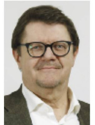
IVO DÜRR, REDAKTION

An dieser Stelle sei darauf hingewiesen, dass nicht nur die Schweizer Gesellschaft Wien jubilierte: 2018 feierte auch der Schweizer Verein Oberösterreich seinen 100. Geburtstag (erwähnt in der Schweizer Revue 5/2018). Im Jahr 2019 sind die Schweizer Schützengesellschaft Wien mit ihrem 60-jährigen Jubiläum und der Schweizer Verein Tirol mit seinem 100-jährigen Bestehen an der Reihe.