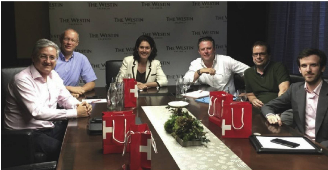
Die Honorarkonsulin bei einem Treffen mit Schweizer Unternehmern in Valencia