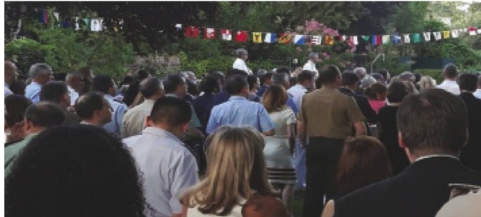
... welche von den Anwesenden mit Aufmerksamkeit verfolgt wurde. - ... qui a été suivi avec attention par les personnes présentes.