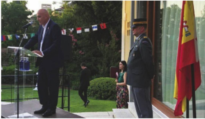
Botschafter Haas während seiner Rede... - L'Ambassadeur Haas lors de son discours...

Es ist schon Tradition, dass der Schweizer Botschafter für Spanien und Andorra zur 1. August-Feier in seine Residenz einlädt. Auch die-