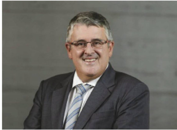
Beat Kaser, -neuer Generalkonsul in Barcelona - Beat Kaser, nouveau Consul général à Barcelone