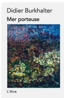
DIDIER BURKHALTER: «Mer porteuse». Editions de L'Aire, 2018, 194 Seiten CHF 24.00, Euro 24.00

«Mer porteuse», Didier Burkhalters drittes Werk, entstand am Neuenburgersee. Die poetische Prosa dreht sich um Abstammung und die Macht unserer familiären Wurzeln. Eine Hauptrolle in dieser Geschichte eines zurückgelassenen Kindes spielt der Atlantik, Symbol der Trennung, aber auch der Verbindung zwischen den Menschen. Der Altbundesrat schreibt mit geschliffener Feder, so etwa in der Passage, in der die Rauchwolken eines Ozeandampfers das Schiff mit dem Himmel verbindet, «als ob es sich fürchtete, von den Tiefen verschlungen zu werden». Der Schwachpunkt: eine gewisse Trägheit oder Schwülstigkeit in der Formulierung, welche die Indifferenz als «haarsträubend» und den Ozean überdeutlich als «Ozean der Verzweiflung» zu erkennen gibt, der eine der Romanfiguren überwältigt.