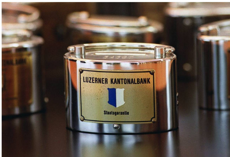
Mit dem Sparkässeli wurde über Generationen die Nation zum Sparen erzogen: Historisch tiefe Zinsen machen es nun zum anachronistischen, musealen Relikt.

Vermutung Nummer 3: Statt nach alternativen Anlageformen zu suchen, heben Schweizer Sparerinnen und Sparer vermehrt ihr Geld ab – und stecken es unter die Matratze. Ganz neue Zahlen zu dieser These gibt es zwar nicht. Aber