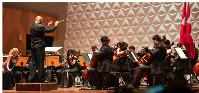
Orquestra Sinfônica Jovem do Rio de Janeiro

Esperamos que as relações entre a Suíça e o Brasil se fortaleçam cada vez mais!