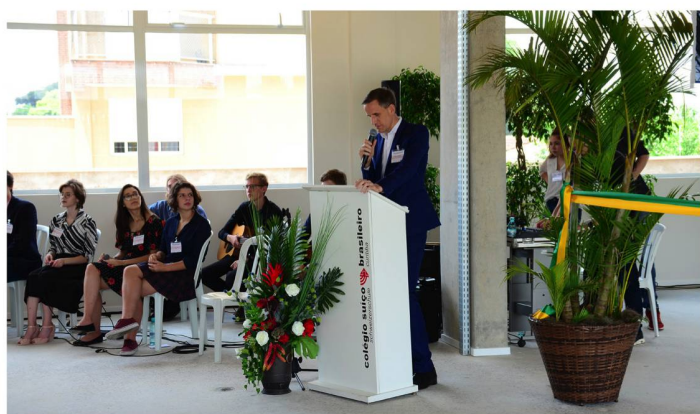
Cerimônia de abertura