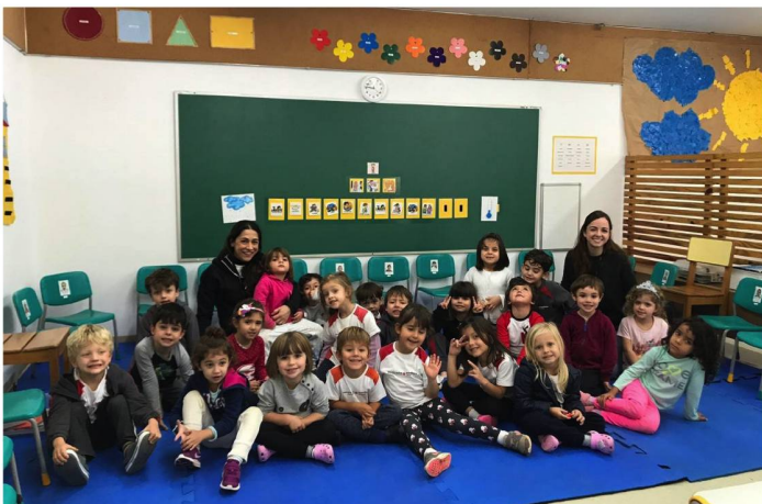
Alunos de Educação Infantil

O Jardim I é o primeiro ano da Educação Infantil. É a base estrutural do aluno dentro da escola. É quando terá o primeiro contato com a instituição e com os princípios e conceitos que regem o nosso ambiente escolar. Trata-se de uma importante fase, na qual o aluno começa a criar vínculos e desenvolver o prazer de vir à escola.